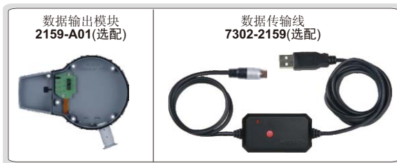
数据输出模块 2159-A01(选配)