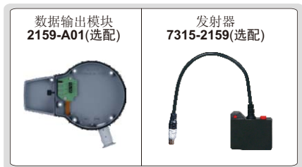
数据输出模块 2159-A01(选配)