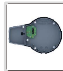
蓝牙数据输出模块 2159-A02(选配)